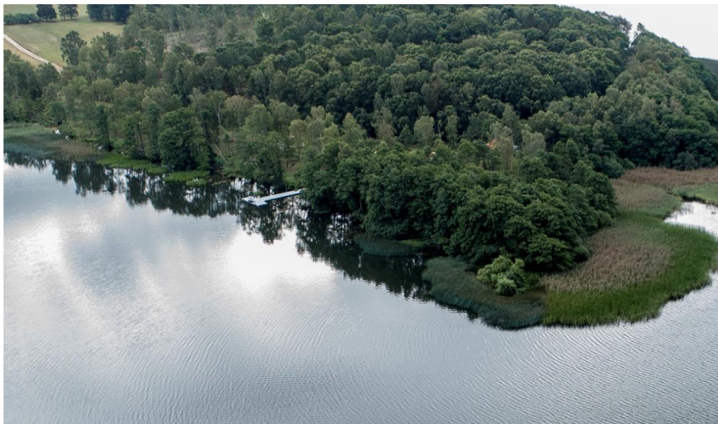
Dronefoto fra den 5. august 2019