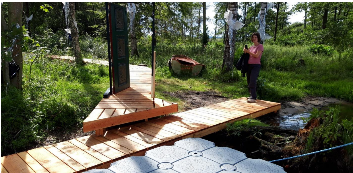
Boardwalken –foto fra den 8. august 2019

Kontakt vores Databeskyttelsesrådgiver (DPO), hvis du har spørgsmål om dine databeskyttelsesrettigheder, begæring om indsigt eller andet: